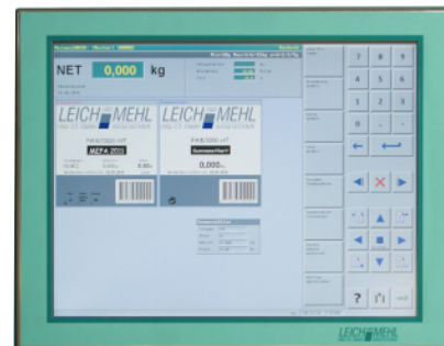
Bedieneinheit LPR 2000